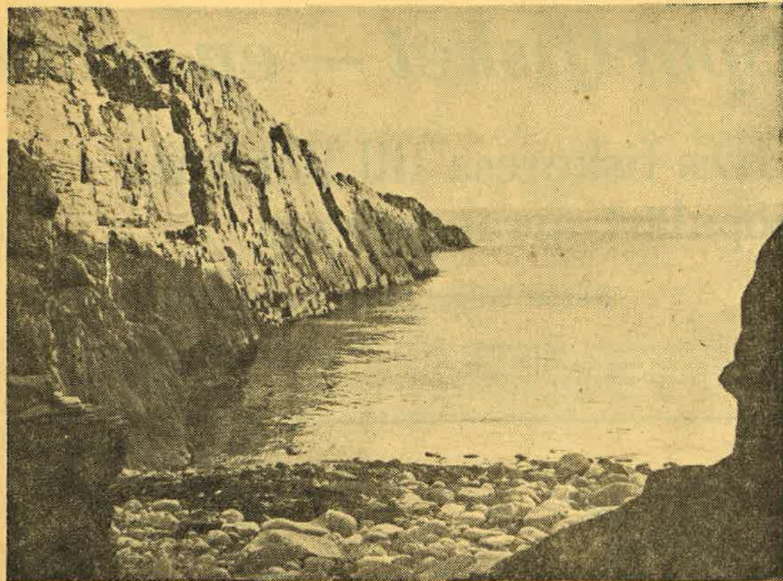
Den schweiziske författaren fäster sig särskilt vid de s. k. malarna med deras runda stenar

Följande dag gör författaren en rundvandring och konstaterar att Kullaberg är en triangel med fyrtornet i spetsen och i de andra hörnen Mölle och bergets högsta topp, Triangeln är ungefär en timma lång och en halv timma bred från hav till hav. Berget liknar Alperna, men kullarna är gröna helt över. I mitten av berget är den vackra skogen, där arrendatorn bor. Han beskriver så bergets geologi. Det är granit som formar berget till otroliga figurer. Grottor är urholkade. Klipporna låg både våg- och lodrätt. Längst nere vid stranden fann han stenar, som var alldeles klotrunda och han tar med sig några som minne. Han lyssnar också till det egendomliga rasslandet, då vågorna drar stenarna opp och ner. Han undersöker fenomenet och finner att det fordras en bestämd vinkel mellan vattenytan och strandlinjen för att rasslet ska komma