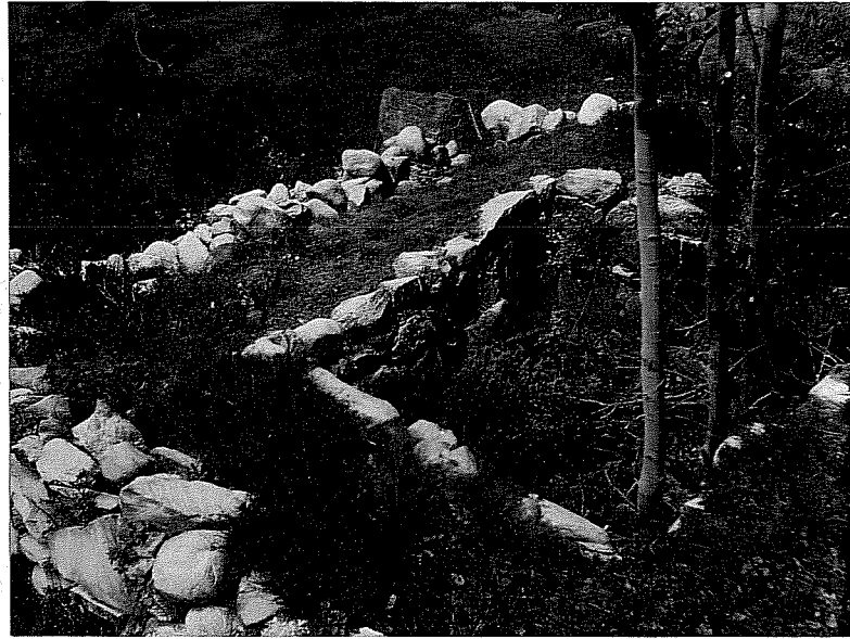
neg. nr. IV:12:36.