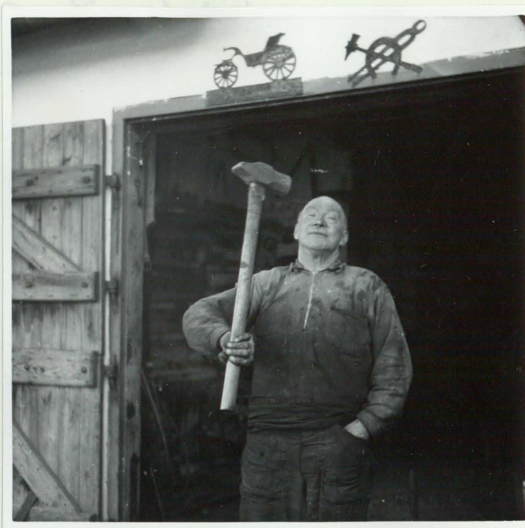
Kraftprov. "Kyssa släggan".