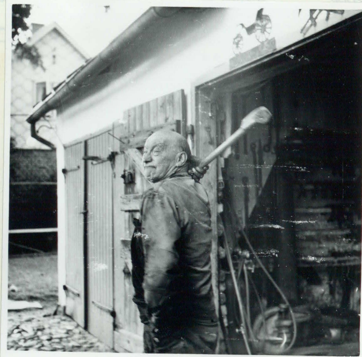
Kraftprov. "Lyfta släggan bakom nacken."