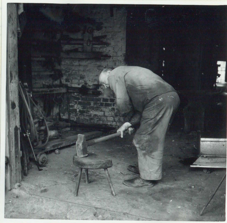
Kraftprov. "Lyfta släggan". wig. nr. IV: 15: 36.