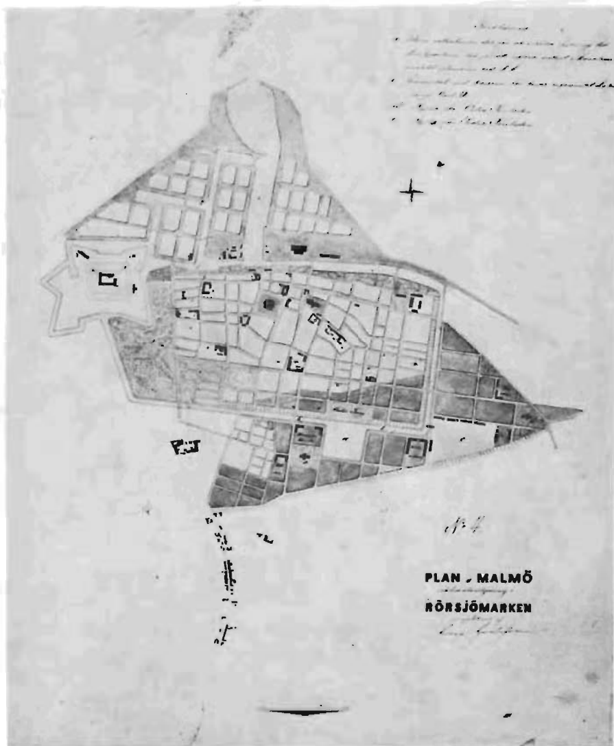
Georg Gustafssons sannolikt första plan för Rör sjömarken. Observera hur kanalen rätats ut och försetts med en stor bassäng på den gamla Rör sjöns plats.

baka med en hänvisning till magistratens anmärkningar mot kanallfrågans lösning 5 .