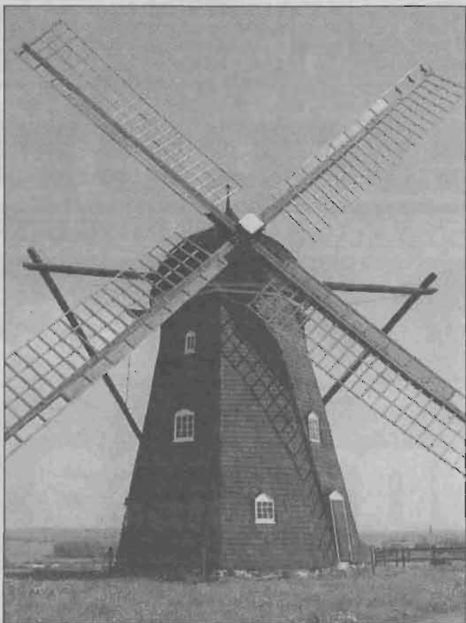
Ausås mölla i all sin glans.

Den står på en låg grund istället för de höga murade som gjorde det möjligt att köra in under holländarna. Som en följd därav är Ausås mölla både lägre och mindre till omfånget.