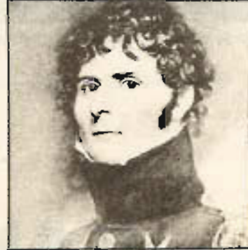
Carl Johan, som kronprins i svensk generalsuniform. Målning från 1810 av Francois Gerard. Drottning Hedvig Elisabeth Charlotta ger i sin dagbok en målande bild av Carl XIV Johan, vid hans ankomst till Stockholm 1810:

Så snart Carl Otto Mörner fått reda på kronprins Karl Augusts död, begav han sig från sin förläggning in till Stockholm, där han uppsökte sin blivande sväger, hovkanslern Gustaf af Wetterstedt. På dennes rekommendation erhöll Mörner uppdraget att resa som kurir till Paris.