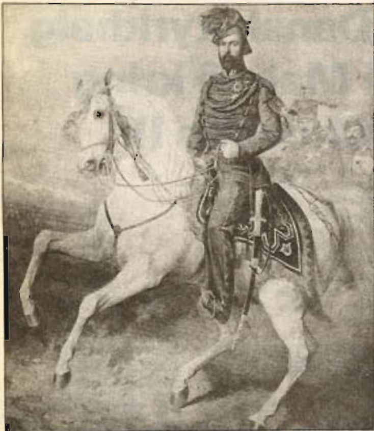
Carl XV till häst, målning av C.F. Kiörboe 1860 (Nationalmuseum). Carl XV var en skicklig ryttare, som gärna visade sig till häst.

hälsotillstånd radikalt och 1857 drabbades han av förlamningar, troligtvis som följd av en hjärntumör. I september 1857 var det tåmligen klart att han aldrig igen skulle kunna återta regeringen. Hans äldste son inträdde som regent. Två år senare, i juli 1859, avled Oscar I, då 60 år gammal.