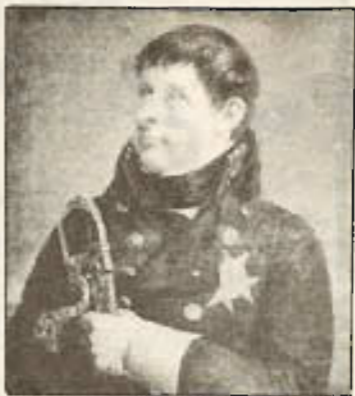
Karl August som svensk tronföljare 1810 (målning av Per Krafft på Gripsholm). Sedan Karl XIII efter statskuppen 1809 blivit Sveriges kung, valdes den 18 juli 1809 den danske prinsen Christian August till tronföljare. Men Karl August, som han kallades senare, avled oförväntat i maj månad 1810, annars hade Bernadotterna troligtvis aldrig kommit att bli svenska regenter.