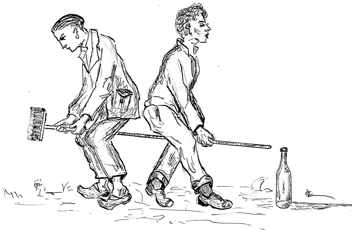
Teckning av fröken Elsa Lindblad, Lund.