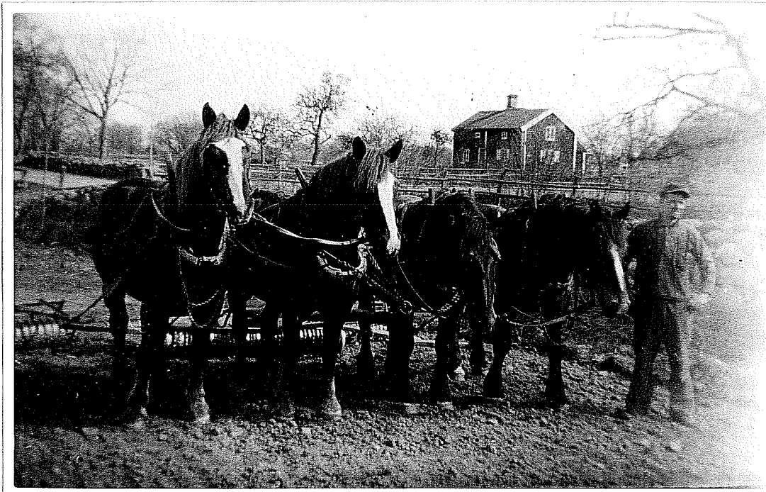
Vårjorden köres. Bild från det moderna Värnanäs. - På godset är det nu sed att man spänner fyra hästar för de tunga jordbruksredskapen.