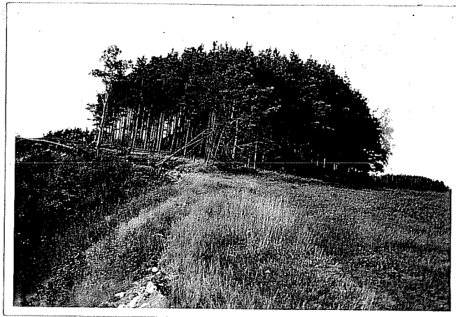
I: 8: 38.

Brunnehöj i Ahla i Laholms landsförsam- ling.