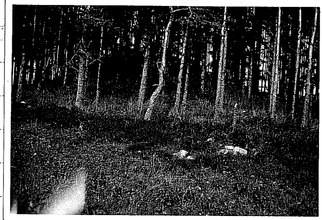
I: 8: 39.