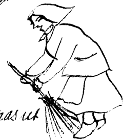
Julen sopas ut

Även förkommer sålut och klackning morg. i byn på nyårs- måndagen kl. 12.