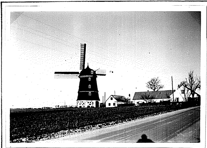
Med alla fyra vingarna i behåll står fortfarande Hagestadsborgskvarnen.