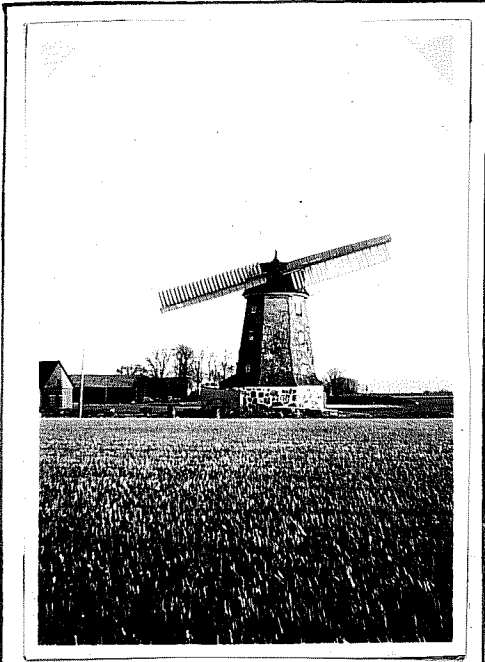
Byakvarnen sådan den tog sig ut efter den ödesdigra höststormen 1949.

Det började hösten 1949 med byakvarnen, som en dag föll offer för en hård höststorm, efter att ha tjänstgjort i mer än ett sekel. Då blåste två vingar ner. En tid fortsatte kvarnägaren att mala med hjälp av de återstående två vingarna. Kvarnägaren övervägde då möjligheterna som fanns; att reparera kvarnen eller att modernisera den med elektriska motorer. Det sistnämnda segrade, ty det visade sig mest ekonomiskt. De återstående vingarna nedmonterades således och drivkraften ersattes av