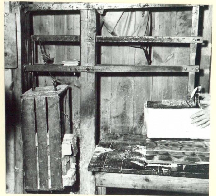
neg.: X: 1: 58: 7-24.