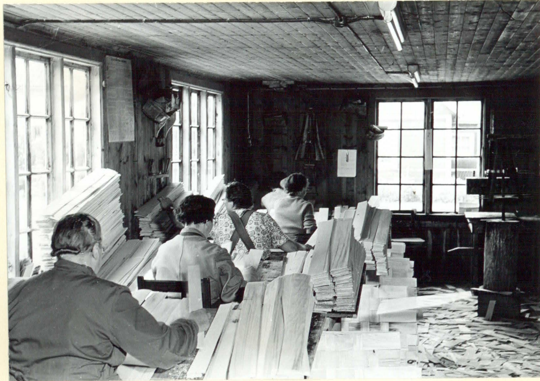
Flätning av bottnar till fruktorgar.