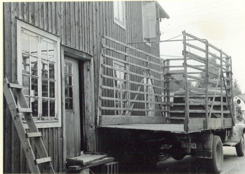
"Häckbil" för transport av spånkegar.