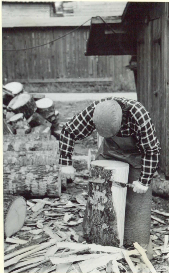
Alfred Bengtssons Korgfabrik, Lönsboda. Barkning av en klamp.