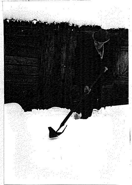
Skäretjärn. (Gårds i Gnosjö heml. förening.) foto: H. E. Bröström; neg. saknes.