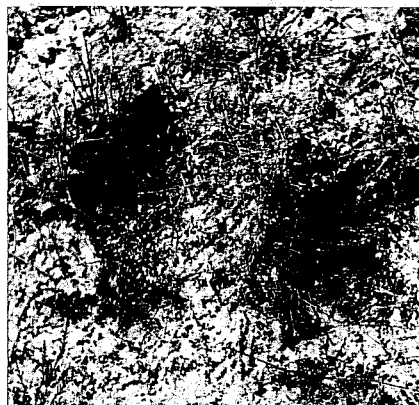
Två av Svärjarehålorna. Foto december 1958. Marken är lätt snötäckt, vissna grässtrån och örter hänger delvis över de nakna hålorna.