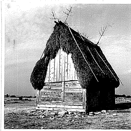
Neg. VI:5:76:4 Lambgift vid färjeinloppet på Fårön