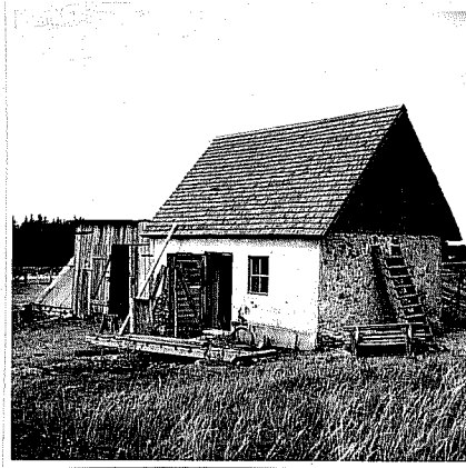
Neg. VI:5:76:2 Snickarboden