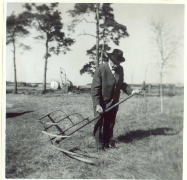
Hur man håller en meja vid skörd