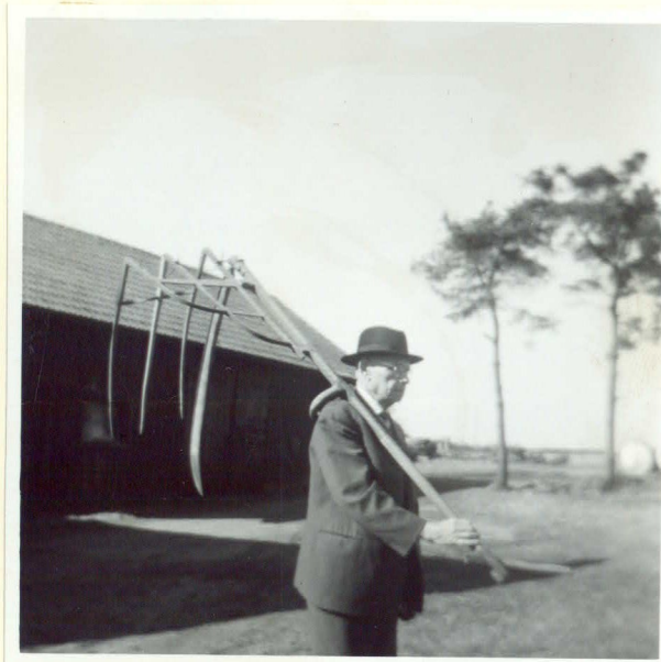
Hur man bär en meja

fotogr. inlämnade av f.d.lantbr. Per Olsson, Rinkaby, 1963 (neg.saknas)