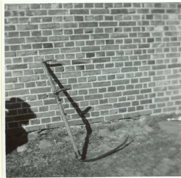
En lie med lieskaft