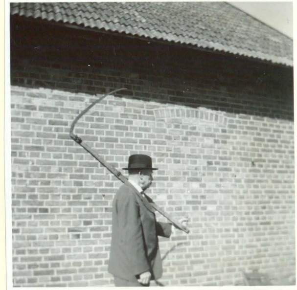
Hur man bar en lie till och från slåttern.

fotogr. inlämn. av f.d.lantbr. Per Olsson, Rinkaby, 1963. (neg. saknas)