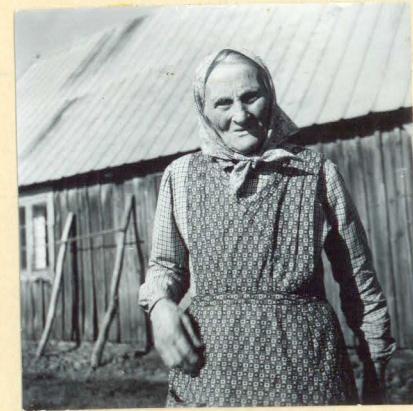
neg. nr VII: 17: 35