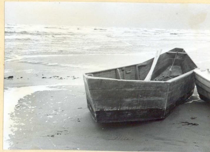
neg. nr. X: 2: 21: 10.

Fiske: Förr fiskades mycket mer än nu. Tio familjer livnärde sig huvudsakligen på fiske för 30 år sedan. Nu är min bror och jag de enda fiskare som finns här. Det är djuphavsfisket som tar mycket av fisken. Det är dåligt med spätta. Piggvar får vi en om året. Förr fick man flera hundra kilo årligen. Sjötungan däremot försvinner ej. Lax fanns mycket förr (på 20- och 30-talen). Man lade ut nät eller ryssjor med maskor på sex cm. Maskorna får ej vara mindre, för allt utom lax ska gå igenom och småfisken röra sig fritt i ryssjorna. Man gick ut i laxekor. Laxekor är flatbottnade kantiga båtar som är lika i för och akter. De användes vid grunda kuster, där de höga kortändarna kommer väl till pass i hög sjö. Förr användes de längs